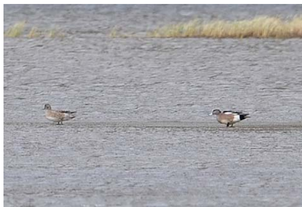
Amerikablesand par, Strandafjorden 08.05.09.

(Nord-Amerika). Denne sjeldne nordamerikanske arten observeres nesten årlig i Norge, men svært sjelden i par som dette. Dette er første funn av arten i Buskerud.