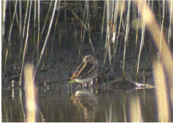
Kvartbekkasin Linnestranda 18.10.09.