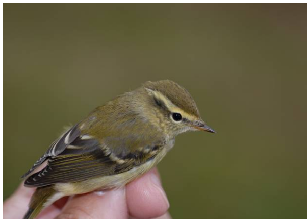
Gulbrynsanger Finset 17.09.09.

Meget sjelden gjest på høsttrekket i Buskerud. Det er tidligere kun gjort ett funn til av arten i fylket - på Averøya (Ringerike) 04.10.75 (T.Anker-Nilsen, K.Jerstad). Også det individet ble fanget og ringmerket.