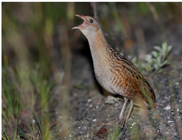
Åkerrikse Rustan N 11.06.09.

Mange observasjoner i 2009. Observasjonene i Øvre Eiker antas å dreie seg om to forskjellige individer da det den 12/6, i forbindelse med et feltkurs på Darbu folkehøyskole, ble hørt to individer samtidig i området Rud-Rustan (ref. Mona Bakke). Habitatsdata m.m. ble innsamlet til NOFs Åkerrikseprosjekt i 2009. Alle åkerriksene i Kongsberg, Øvre Eiker og Lier sang i graseng. Ingen av disse individene ble gjenfunnet ved kontroller i slutten av juni etter at engene var slått. Åkerriksene på Steinsletta og Austjordet i juli oppholdt seg i kornåkre. Det er ikke utenkelig at fuglene i sør har flyttet nordover etter at grasengene ble slått. Arten ankommer normalt Buskerud ultimo mai, gjennomsnittlig ankomstdato: 27.05. (13 år).