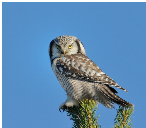
Haukugle øvre Skurdalsstølane 19.09.09.

Arten hekker spredt i øvre deler av fylket i gode smågnagerår. Antall observasjoner av haukugle begynte å øke høsten 2008, og 2009 ble et rekordår for arten med svært mange funn, særlig i de nordlige delene av fylket. Det ble også gjort et par reirfunn der haukugler hekket i kvistreir oppe i gamle kråkereir i fjellbjørkeskogen. I Ustedalen på Geilo vokste det opp tre unger (B.Sloan).