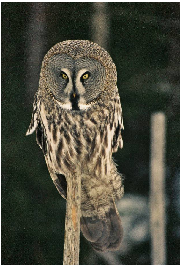
Lappugle ved Drolsum 05.03.08.

Opplysning om observasjonen ved Drolsum i 2008 ble funnet i boka til Arnt Berget 2009: Holleia – Tiurens rike. Fjærfunnet i Øvre Eiker ble bekreftet å stamme fra en lappugle av Roar Solheim, mens lappugla på Hvervenmoen ved Hønefoss ble gjort kjent via et mobiltelefonbilde lagt ut på Artsobservasjoner.no (en lappugle ble muligens sett her også primo april 2010 i følge Siste Nytt i Vår Fuglefauna 33 (2010), nr.2).