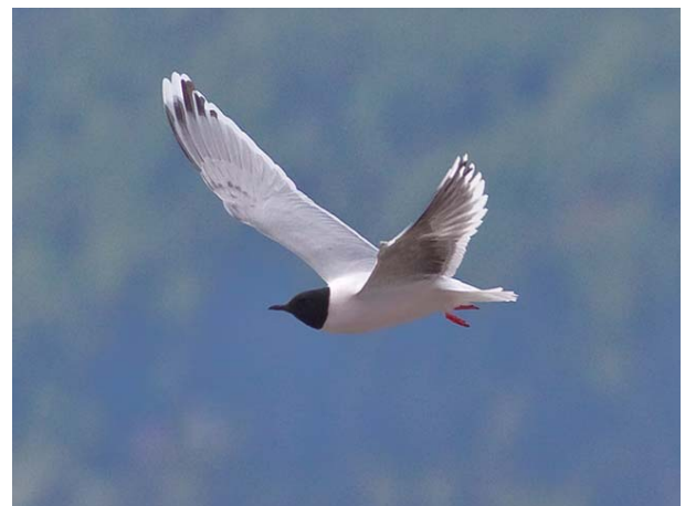
Dvergmåke 3K Linnestranda 16.05.09.

Arten er observert nesten årlig i Buskerud de siste årene. De fleste funnene blir gjort om høsten (august-oktober), mer sporadisk i mai som de 2 ind på Linnestranda.