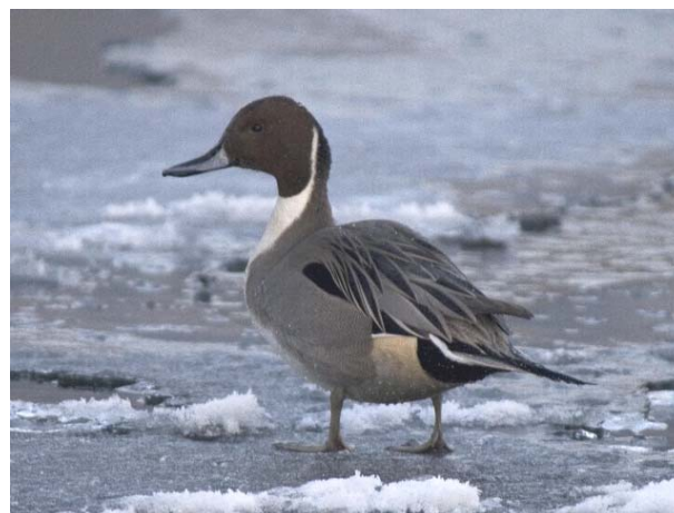
Stjertand hann, Steinberg 10.01.09.

Vinterfunn av stjertand er sjeldne i Buskerud (antall funn/ind på artslinjen gjelder bare vinterfunn). Dette er andre vinteren på rad at denne(?) hannen har overvintret i Drammenselva. Fåttallig hekkefugl i nordfylket.