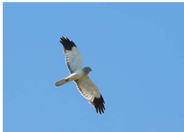
Myrhauk hann, Ustaoset 21.06.09.

Arten hekker fåtallig i fylkets nordlige deler, noe som også flere hekkefunn i 2009 viser. I nedre deler observeres den fåtallig, men regelmessig på vårtrekket (medio april – mai) og høsttrekket (ultimo august – oktober), gjennomsnittlig ankomstdato: 20.04. (30 år), tidligere i seinere år. Mange funn de to siste årene.