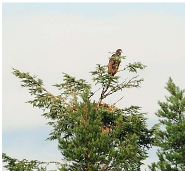
Havørnungen på reiret i Røyken 28.07.09.

Arten observeres nå årlig i Buskerud, og stadig hyppigere som det framgår av grafen ovenfor. De fleste observasjoner blir gjort i vinterhalvåret (november - mars). De seinere åra er arten blitt observert stadig hyppigere i Røyken og Hurum, også i hekketida. Dette har sammenheng med at havørna i 2008 hekket på Håøya i Frogn (Ak), for første gang i Oslofjordsområdet på over 126 år. Reiret på Håøya skal ha falt ned påfølgende vinter, og paret flyttet da reiret over til Buskerud-sida av fjorden, der de hekket vellykket og fikk fram en unge i 2009. Dette reiret ble ikke oppdaget før ungen var flygedyktig i slutten av juli. Dette er første kjente hekkefunn av havørn i Buskerud! Observasjoner i Røyken og Hurum regnes som ett funn av 3 ind. Også flere av observasjonene i Ål og Hol dreier seg trolig om de samme individene.