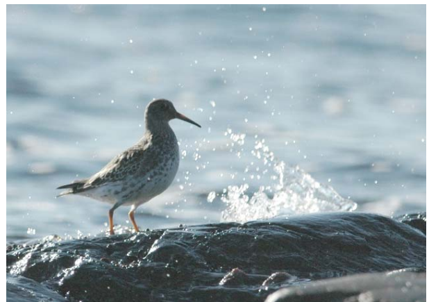
Fjæreplytt Mølen 13.10.09.

Arten hekker spredt i indre fjellstrøk, men få hekkefunn blir rapportert. Meget sjelden å se på trekket og om vinteren i nedre deler av fylket.