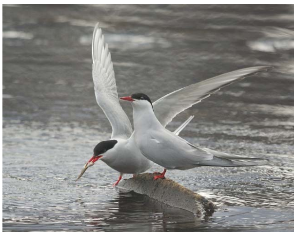
Rødnebbterner Ustedalsfjorden 22.05.09.

2009 HOL: 1 ind m/mat til unger Skurdalsfjorden 02.07. (H.Meyer, A.G.Meyer). ØVRE EIKER: 1 ad + 1 juv Fiskumvannet 12.09. (S.Stueflotten, mfl.)