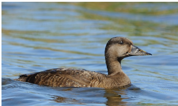
Svartand hunn, Krækkjahalltjørne (Hol), 03.07.09.

Sjelden men nesten årviss vintergjest, hyppigst observert rundt Hurumlandet. Hekker i fjellet i nordfylket. Flere observasjoner i aktuelle hekkebiotoper.