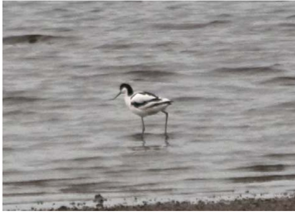
Avosett Linnestranda 08.06.09.