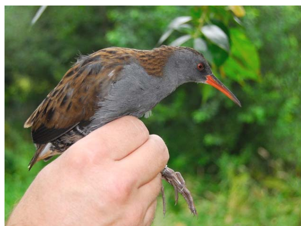
Vannrikse Miletjern 15.08.09.

Arten er i seinere år blitt observert årlig i perioden mai – november, hyppigst ved Fiskumvannet. Gjennomsnittlig ankomstdato: 10.05. (11 år). Funnet på Miletjern er første gang en vannrikse er blitt fanget og ringmerket i Buskerud.