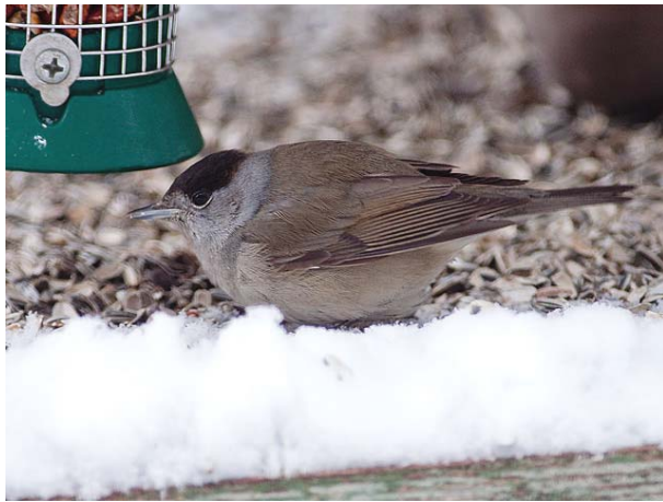
Munk hann, Linneslia 08.02.09.