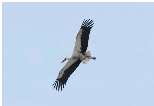
”Sture Stork” på Trollmyra 24.03.09.

2009 RINGERIKE: 1 ad Trollmyra avfalls plass, Eggemoen 24.-25.03.* (F) (K.Myrmo, J.L.Hals, mfl.).