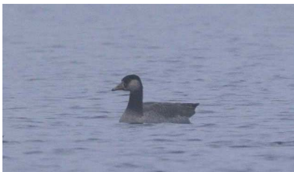
Hybrid grågås x kanadagås Vik 20.10.09.

Alle de fotodokumenterte individene viste karaktertrekk til typiske hybrider mellom grågås og kanadagås, som er den vanligst forekommende gåsehybriden i Norge. 1-2 ind av slike hybride gjess er sett flere ganger i Tyrifjordsområdet de siste årene, og alle funnene dreier seg trolig om de samme individene. Dette er første gang denne hybriden er godkjent med fotodokumentasjon i Buskerud.