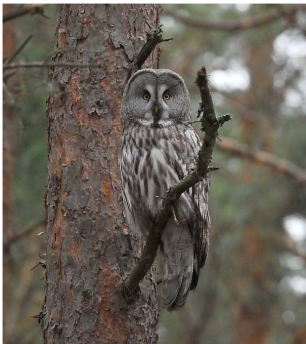
Lappugle Hvervenmoen 29.11.09.