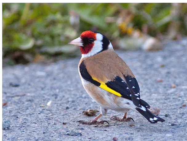
Stillits Linnestranda 13.05.09.

Stillits Carduelis carduelis hekking R 2009 LIER: 1 par matet 2 utfløyne unger Linnestranda 14.08. (J.E.Nygård), parring observert 22.04.