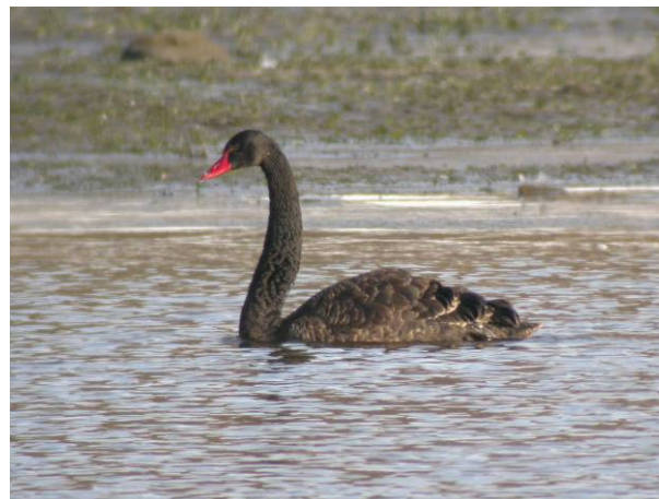
Svartsvane Vestfosselva 21.03.09.

Svartsvane er opprinnelig en australsk art, som nå er vanlig parkfugl flere steder i Europa, også i Norge, og som også skal reprodusere i vill tilstand i noen land. Funn er plassert i kategori E (funn av arter som regnes som rømlinger i Norge). Svartsvane trakk bort sammen med ni sangsvaner 16.04. kl.08 (J.E.Nygård). Den ble sett ptNØ over Fornebu kl.09:15 samme dag (J.E.Røer).