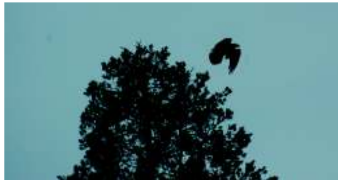
Fig. 3: Ravn letter fra en furutopp nær Goasholtmyra fyllplass og begir seg på vei mot overnattingsplassen.

Fra amerikanske undersøkelser (sitert fra Heinrich 1999) hvor ravn, merket med radiosendere eller andre form for merker, ble fulgt fra de felles overnattingsplassene til furasjeringsstedene og tilbake igjen etterpå, er det kjent at de kan dra meget langt av sted på sine daglige næringsøk. I et tilfelle dro de så langt av sted som 88 km fra overnattingsstedet, i et annet 90 km, temmelig like maksimaldistanser i disse to eksemplene. I Alaska ble radiomerkede ravner fulgt på daglige rundturer på opptil 130 km. På et annet overnattingssted hadde fugl fløyet hele 483 km for å komme dit. Bruker vi tallene fra de to