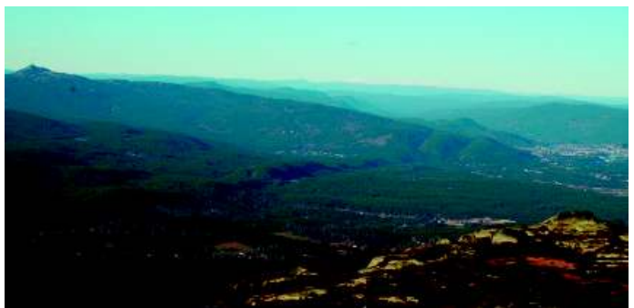
Fig. 2: Utsikt fra Skrimfjell mot Kongsberg (i bakgrunnen til høyre) og Knutetoppen til venstre. Overnattingsplassen ligger i skogen skjult bak fjellknausen til høyre. Ravnetrekket fra Notodden kommer fra venstre over åsen.

Ravalsjøelven, svingte vestover ved Ravalsjøen og dro videre over Holmevann mot Notodden, sannsynligvis til fyllplassen ved Goasholtmyra. I tillegg var det også mindre flokker med fugl som samtidig dro i retning Finnevollaldalen, kanskje til en fyllplass mot Siljan/Skien, og noen som dro over Skrimstoppen mot syd. Bare få fugler ble sett om ettermiddagen