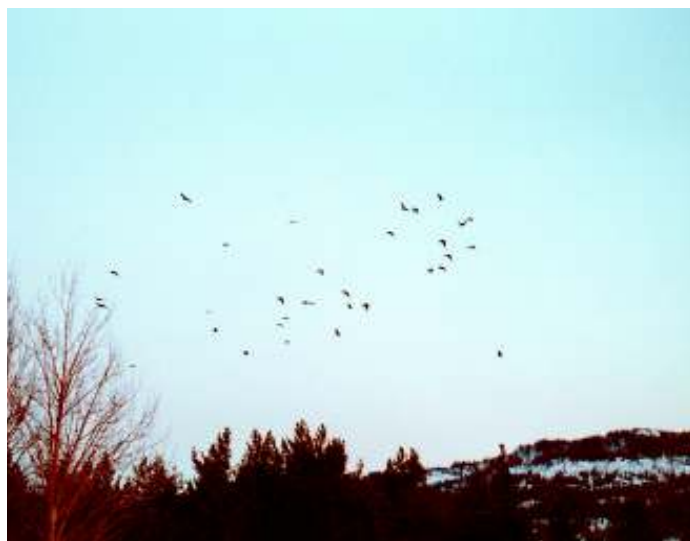
Fig. 4: Ravnetrekk fotografert ved Lauar, like før flokken nådde overnattingsplassen.

Så sent som i midten av januar 2007 kunne det synes som om overnattingsplassen ved Lauar ikke lenger ble brukt. Bare noen få individer ble observert i