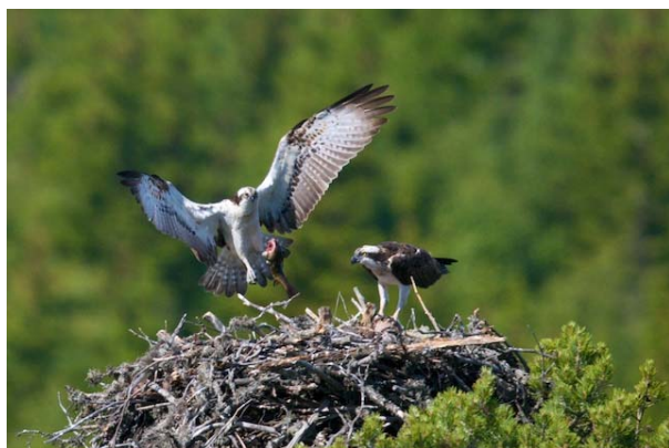
Hannen kommer med en ørret til reiret.

Eggleggingen fant trolig sted siste uka i april. Hunnen ruget mest, mens hannen brakte fisk til reiret 2-3 ganger i døgnet og ruget også i korte perioder (til sammen ca. 3-4 timer per dag) mens hunnen spiste. Klekkingen skjedde mellom 1. og 7. juni. Tre unger, der den ene var mindre enn de to andre. Hannen brakte nå fisk til reiret typisk 5-6 ganger per dag, i hovedsak ørret. Det var hunnen som matet ungene. I juli leverte hannen 5-8 fisk per dag. Hunnen vedlikeholdt reiret ved å tilføre det kvister og lavdotter. Den minste ungen døde i slutten av juli, mens de to største var i gang med flygetrening. I begynnelsen av august var begge ungene fullt flygedyktige. I august leverte også hunnen fisk til reiret et par ganger. Hunnen forlot lokaliteten medio august, mens hannen fortsatte å levere fisk til ungene, men det ble nå stadig lenger mellom hver levering. Litt spesielt: et tårnfalkpar hekket dette året i de nedre delene av fiskeørnreiret.