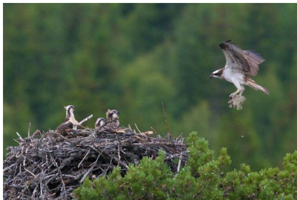
Hunnen bringer en lavdott til reiret.

Et annet forhold som berører fiskeørnas hekkebiologi, har med parets reirvedlikehold å gjøre. Som nevnt over, bringer hunnen kvister og lavdotter til reiret i ungeperioden. At store, gråe lavdotter (reinlav, islandslav o.l.), og kvister med lavdotter på bringes til reiret er også observert ved flere andre reir. Kan det tenkes at laven, som inneholder lavsyre, har en antiseptisk effekt som bidrar til å dempe lukt og annen plage fra råtnende fiskerester i reiret? Foreløpig er det ikke funnet noe om dette i litteraturen, men problemstillingen kan være interessant å følge opp videre.