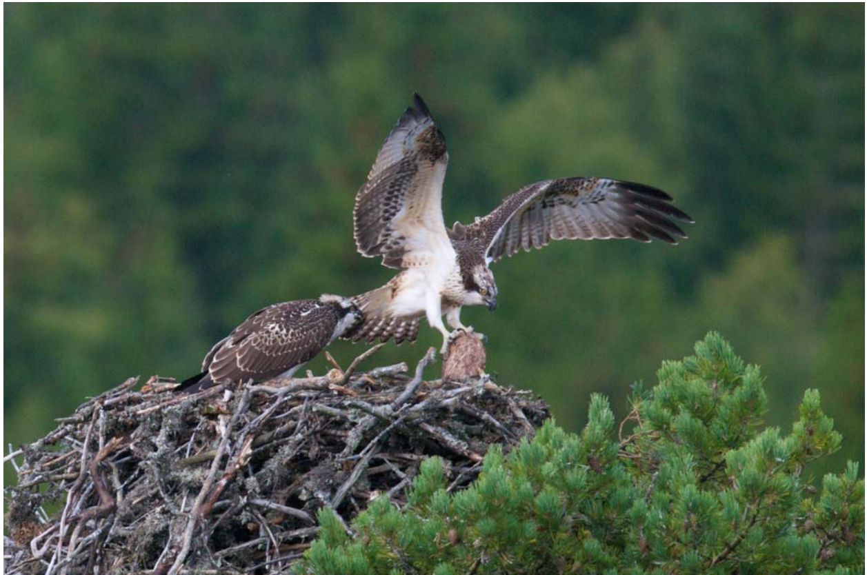
To flygedyktige fiskeørnunger på et reir i Kongsberg i august 2008 (Foto: K.A.Dokka).