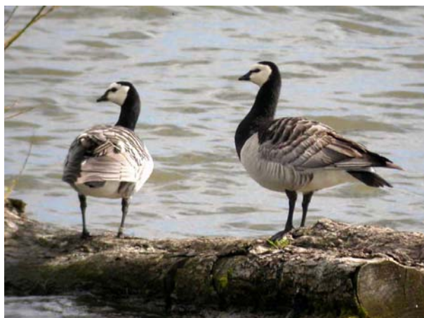
Hvitkinngås, Linnesstranda juni 04.

Antall observasjoner av hvitkinngås har økt mye i Buskerud i seinere år, og arten har nå etablert seg som fast hekkefugl i Oslofjorden. Det hekker nå flere par på holmer og skjær langs kysten av Røyken og Hurum.