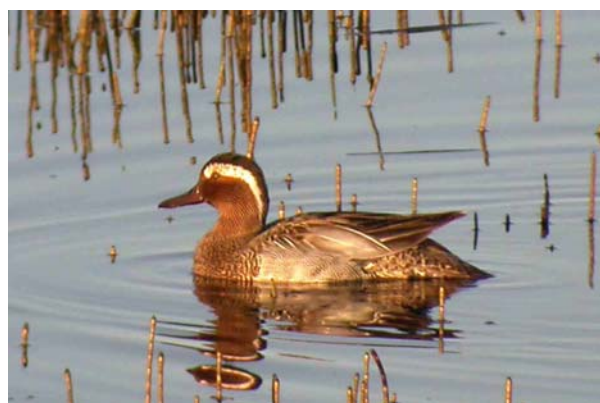
Knekkand, Fiskumvannet, mai 04.

Arten observeres regelmessig men fåttallig, spesielt om våren (april-mai). Gjennomsnittlig ankomstdato: 25.04. (24 år). Det har lenge vært mistanke om at arten har hekket i Buskerud. Observasjonen i Fiskumvannet 25.05. er første sikre bevis på dette.