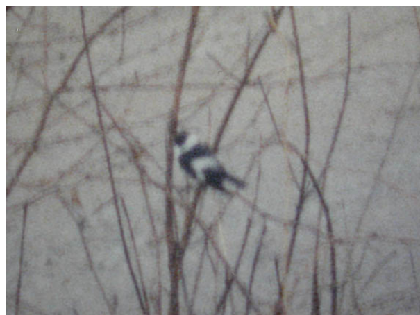
Halsbåndfluesnapper, Sætre, mai 02.