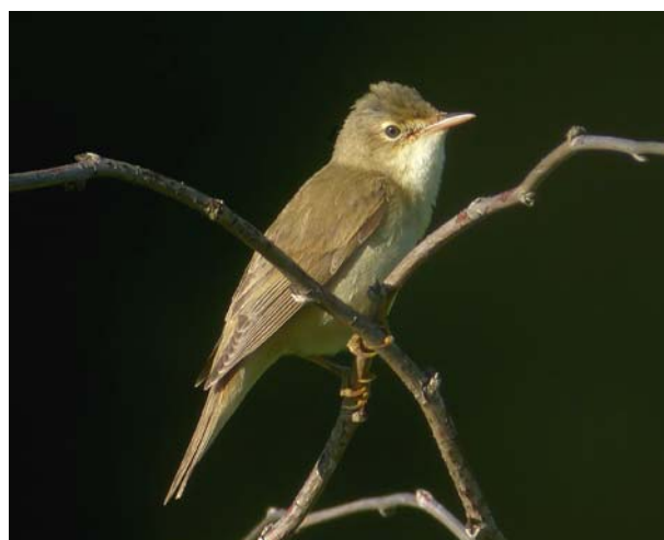
Myrsanger, Linnesstranda 2004.

Arten er blitt stadig vanligere i nedre Buskerud de siste årene, med rekordmange funn de siste årene. Arten ankommer Buskerud i månedsskiftet mai/juni, gjennomsnittlig ankomstdato: 29.05. (17 år).