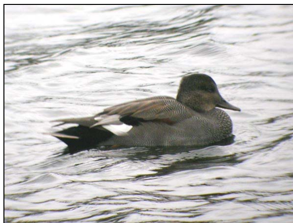
Snadderand, Krokstad, oktober 04.

2004 HOLE: 2M+1F Steinsvika 18-27.04.(B.H. Larsen, K. Myrmo) (kun 1 par 18. og 27.04.). LIER: 2M+1F Linnesstranda 15.04.* (F) (J.E. Nygård, R.E.Andersen). NEDRE EIKER: 1M Drammenselva ved Krokstadelva 02.10.* (F) (S.Stueflotten).