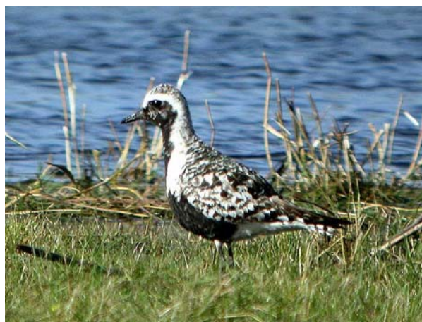
Tundralo, Karlsrudtangen, august 04

Arten opptrer fåtallig og forholdsvis regelmessig på høsttrekket (medio august – primo oktober) i nedre deler av Buskerud, sjeldent ellers.